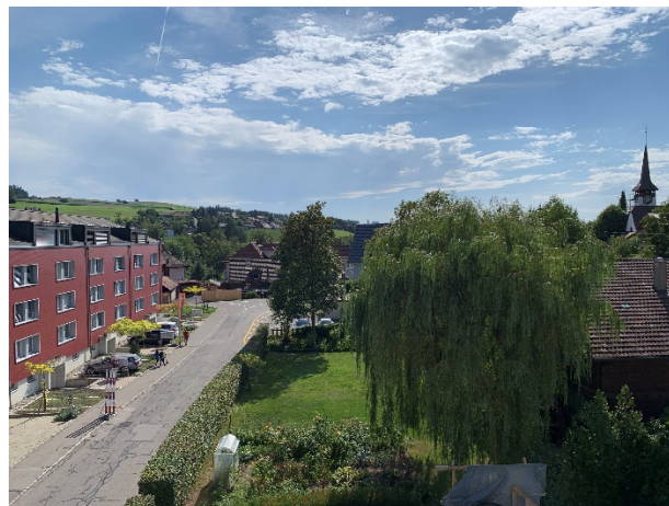
Blick Richtung Westen in die Nachbarschaft