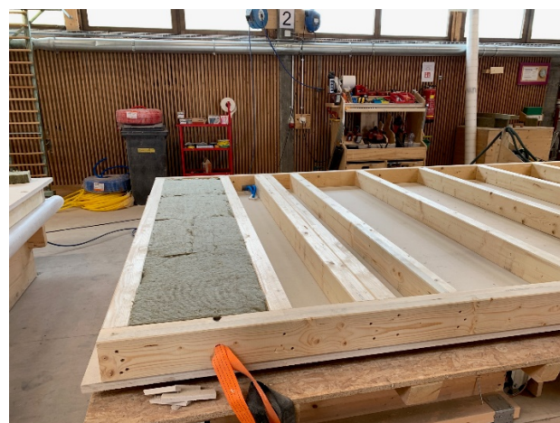
Wandelement in Bearbeitung: Leerrohre Elektro