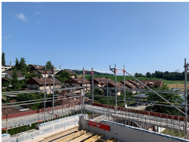
Blick Richtung Osten zum Bahnhof